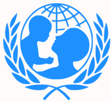
聯合國兒童基金會