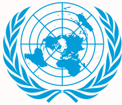
聯合國經濟及社會理事會